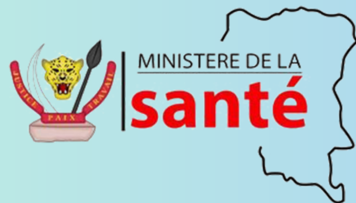
PLATE-FORME DE SAISIE DES INFORMATIONS DES PTF DU MSPHPS

143 AVENUE DE VERDUN, 92442 ISSY-LES-MOULINEAUX CEDEX, PARIS, FRANCE WWW.GINGER-INTERNATIONAL.FR